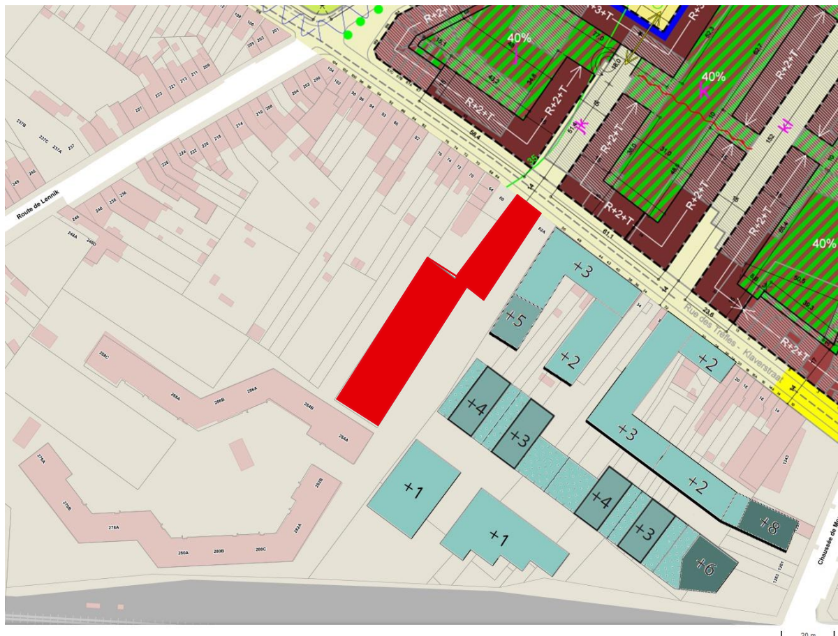
PROJET MIXTE D'AMENAGEMENT DU TERRITOIRE "NOVACITY" (1/2000)