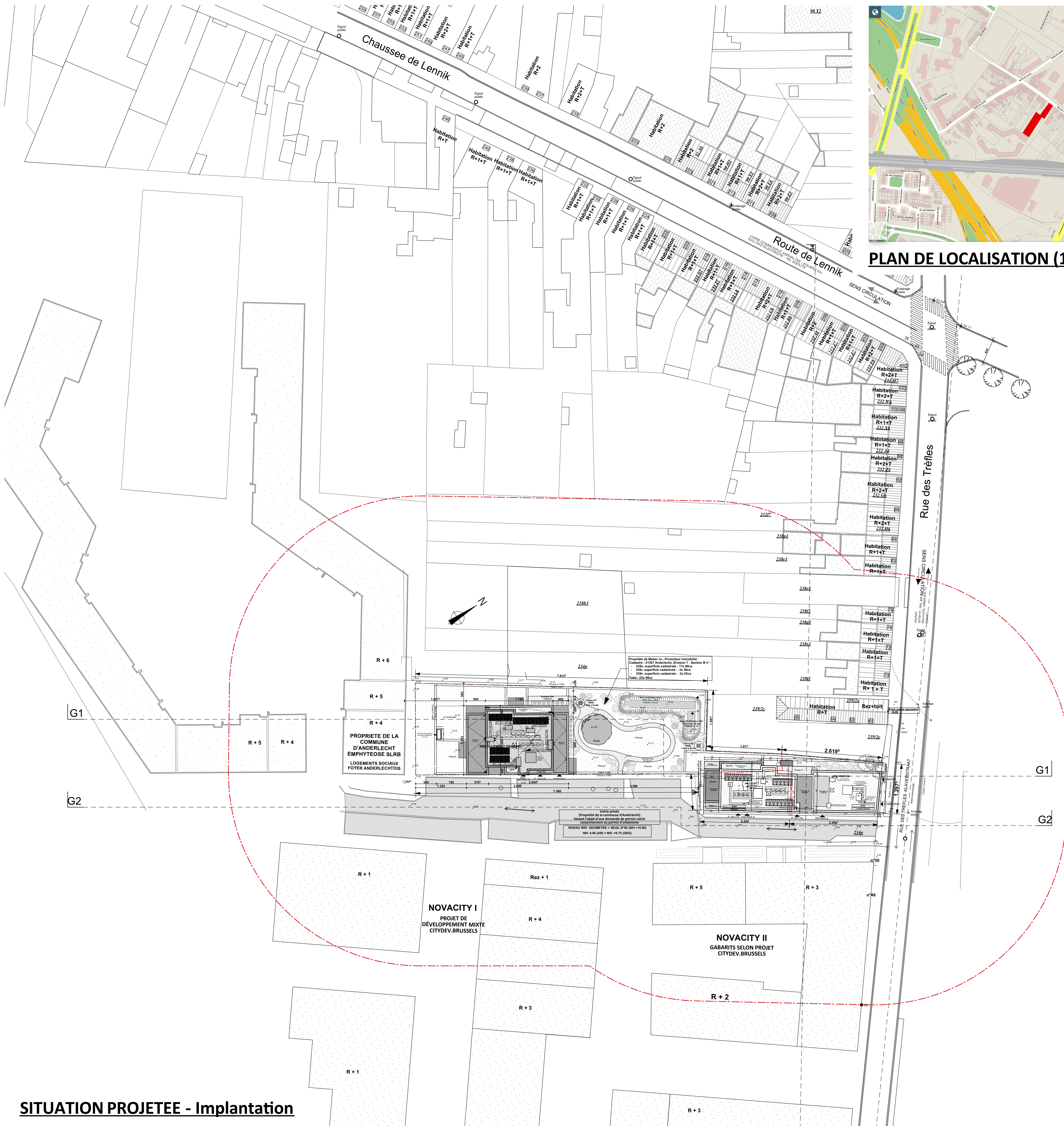
SITUATION PROJETEE - Implantation